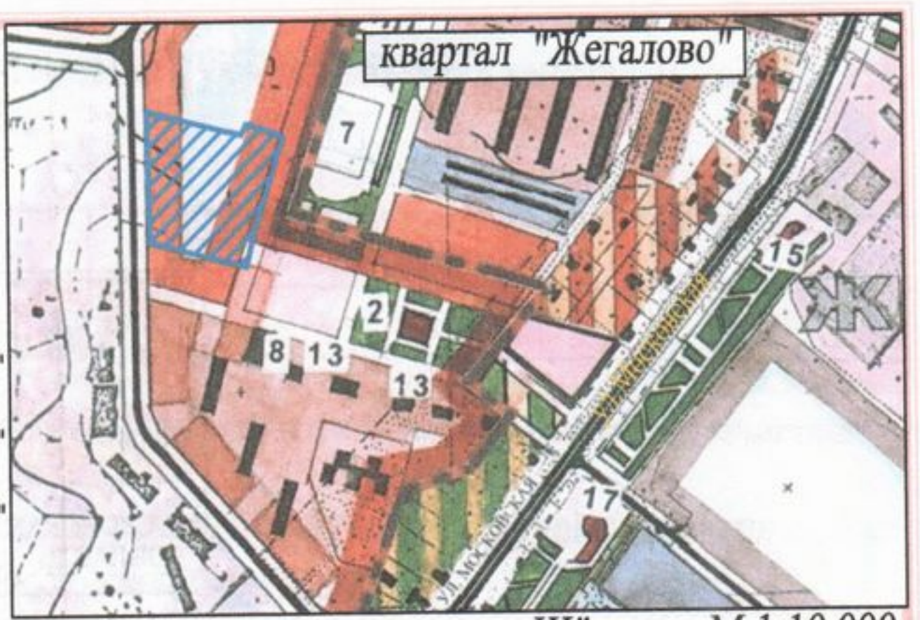
генплан г.Щёлково М 1:10 000

Экспликация: ① - места допустимого размещения зданий, строений, сооружений